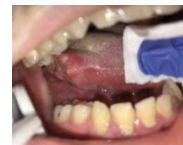
Un carcinome épidermoïde