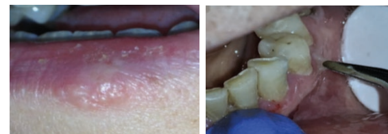
Une récurrence herpétique Une pathologie bulleuse