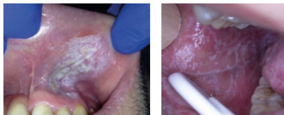
Une leucoplasie tabagique