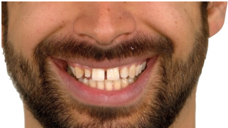
Traitement pluridisciplinaire : traitement parodontal, orthodontique 18 mois puis contentions 13 à 23 et 34 à 44 puis facettes 12 et 22.

Pour cela il faut évaluer grâce à des critères précis le chemin à parcourir, et surtout les bonnes techniques à utiliser en fonction des cas.