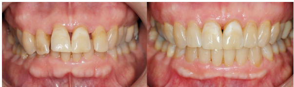
Traitement parodontale puis orthodontique de fermeture des espaces interdentaires